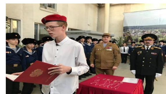
18.11.2022 Посвящение в юнармейское движение