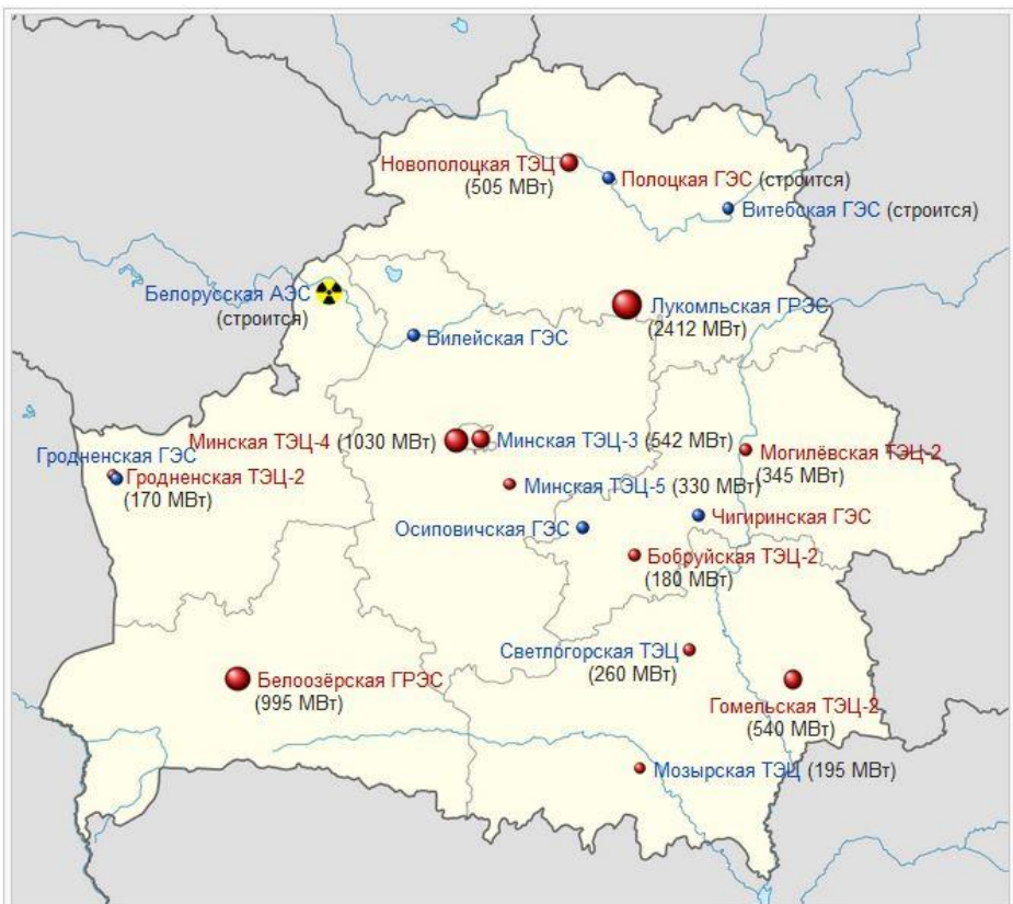
Крупнейшие атомные, тепло- и гидроэлектростанции Белоруссии и их установленная мощность

Белоруссия – одна из немногих стран Восточной Европы, которая стремится к самообеспечению электроэнергией. Здесь ведется активное строительство АЭС и ГЭС, которые в будущем помогут стране получить энергетическую независимость